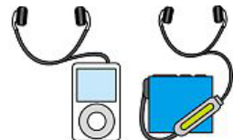
携帯・音楽プレーヤー