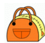
カバン・ハンドバッグ