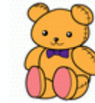
大きなぬいぐるみ