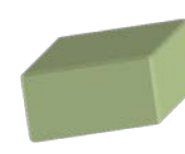
生花吸水フォーム