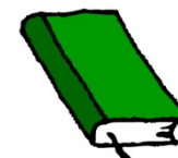
大量の書籍 （聖書、経典、アルバム等も含む）