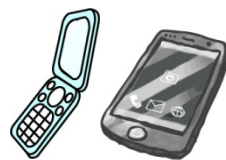
携帯電話・スマートフォン