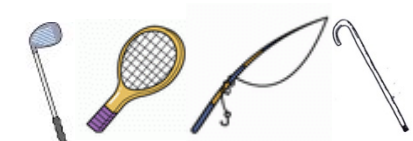
カーボン製品等（難燃性）

※ここに示されているもの以外でも（1）～（6）の項目に該当するものは、すべて火葬に付さないようお願いします