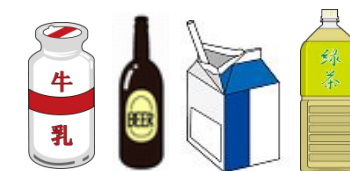
紙コップ一杯を超える量の飲料