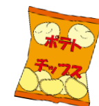
菓子等の個別包装