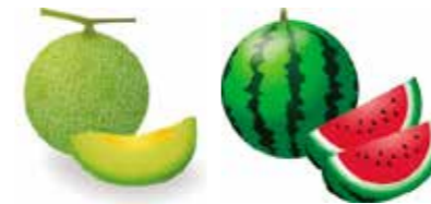
一口大を超える大きさの果物