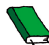
書籍 （聖書、経典、アルバム等も含む）