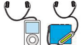
携帯・音楽プレーヤー