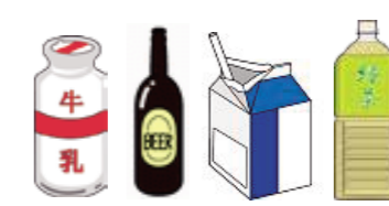
紙コップ一杯を超える量の飲料