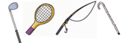
カーボン製品等（難燃性）

※ここに示されているもの以外でも（1）～（6）の項目に該当するものは、すべて火葬に付さないようお願いします