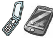
携帯電話・スマートフォン