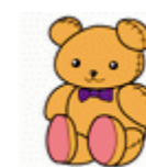
大きなぬいぐるみ